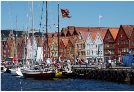
Bryggene i Bergen