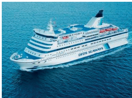
Crown of Scandinavia