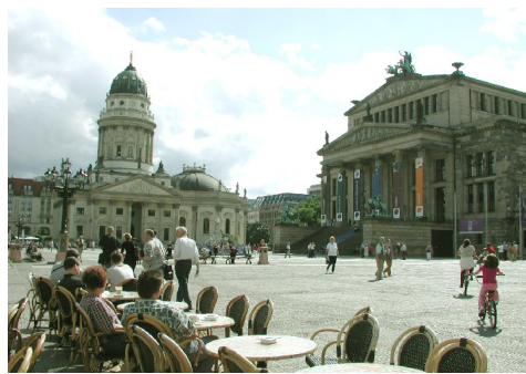
Torget ved Berlindom

Frokost ombord før ankomst København kl.09.30. Turen går sørover til Gedser hvor vi kl. 13.00 tar ferje til Rostock i Tyskland. Videre frem til Berlin på ettermiddagen. Her blir det overnatting i 2 netter på Aldea hotell