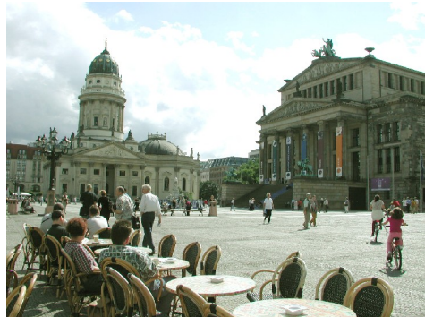
Berliner Dom og ...

Ankomst Oslo kl.09.30. Turen går nordover Østerdalen med stopp på Alvdal. Retur til Trøndelag på kvelden.