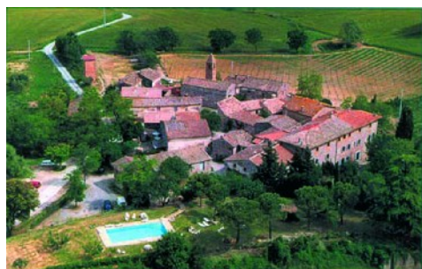
Fattoria san Donato

oliventrær. Hotellet har eget svømmebasseng. Frokost og middag på hotellet under oppholdet.