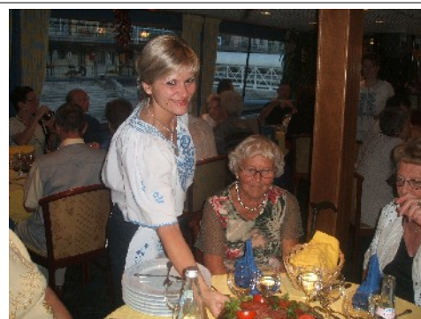
Middag på La Boheme

Ankomst Oslo kl. 09.30. Turen går nordover Østerdalen hvor turens siste middag inntas på Alvdal. Retur til Trøndelag på kvelden.