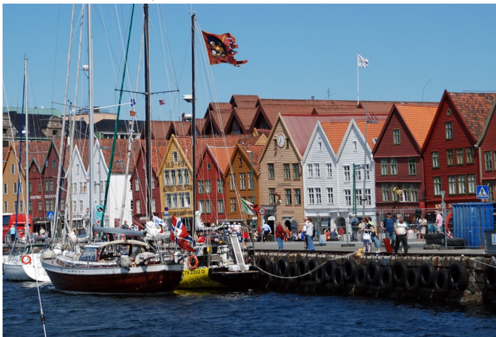
Bryggene i Bergen