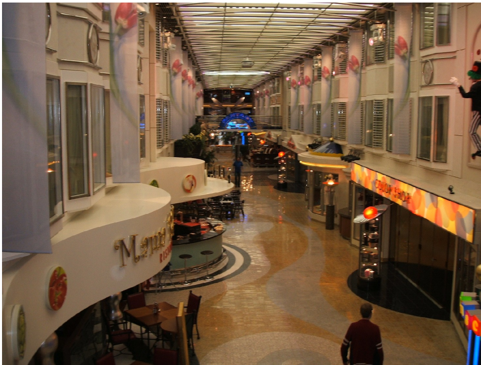
Promenaden, Color Fantasy