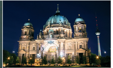
Berliner Dom, Berlin

kjører tilbake til Tyskland og Dresden. Herfra kjører vi forbi Leipzig, Halle og Magdebourg før vi ankommer Celle, en trivelig tysk småby med fine bindingsverkshus. Middag og overnatting på Intercity hotell.