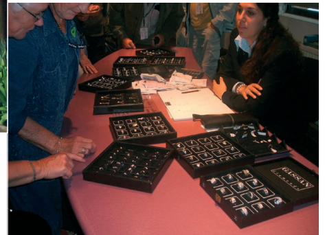
Diamantsliperi i Amsterdam