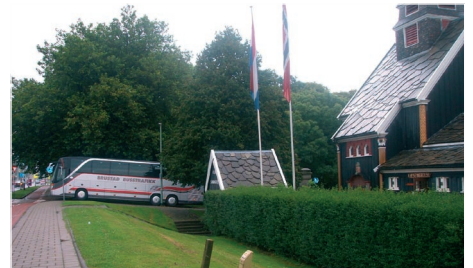
Sjoemanskerk i Rotterdam