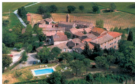
Fattoria san Donato

Denne turen til Toscana foregår med fly til og fra Italia og vi ligger iro i 5 netter på et nybygd hotell midt i Toscanas frodige landskap ca. 25 km sør for Firenze. Under oppholdet inngår interessante utflukter og besøk på ulike steder med mye historie og kultur fra middelalderen. Det inngår besøk på 3 ulike vingårder hvor det blir vinsmaking og lunsj. Videre besøkes byene Siena og Firenze.