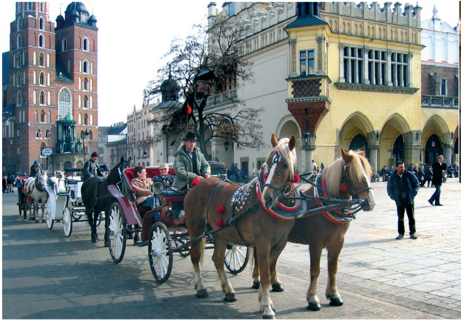
Torget i Krakow