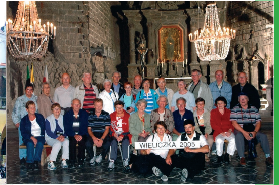
Fra Wieliczka saltgruver

Dette er en rundtur i Polen hvor vi besøker nåværende hovedstad Warszawa og tidligere kongehovedstaden Krakow. Vi har utflukt til Auschwitz og Birkenau. Turen går om Berlin på tur sørover, mens vi på returen tar Stena Line's nattferje fra Gdynia til Karlskrona i Sverige. DFDS's ferjer mellom Oslo og København tur/retur.