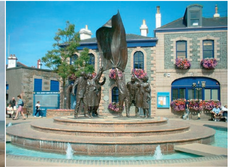
St. Helier, Jersey

Etter frokost på hotellet kjører vi forbi Bremen, Hamburg og til Kiel hvor Color Lines ferje har avgang kl 14.00. Middag/koldtbord