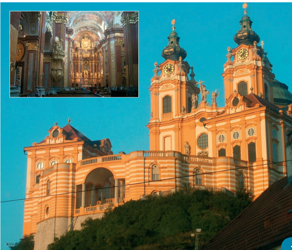
Stift Melk kloster