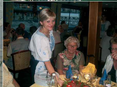
Middag på La Boheme