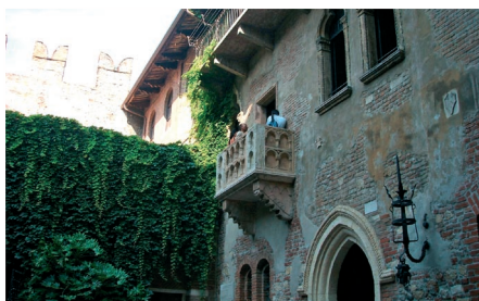
Julies balkong, Verona

Turen går på tyske motorveger forbi Hannover, Kassel og frem til Bamberg hvor det blir middag og overnatting på hotell Residenzschloss.