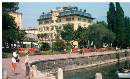
Grand Hotel Riva

Muligheter for avkobling, soling, bading og handling. Det blir en ettermiddag/kveldstur til Verona hvor man kan overvære forestillingen "Aida" på den store utearenaen. Videre blir det en dagsutflukt til Venezia. Her skal vi se på de ulike severdigheter som Markusplassen, Markuskirken, Dogepalasset, glassverk m.m. Det blir også tid til handling og se på gondolene på kanalene.