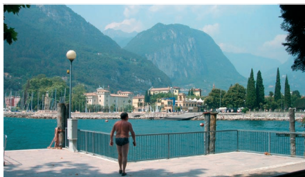
Riva del Garda

Turen går sørover til München og Garmisch Partenkirchen. Videre til Østerrike forbi Seefeld og Innsbruck. Grensa til Italia passeres ved Brennerpasset. Videre forbi Bolzano og Trento før vi tar av mot Gardasjøen og byen Riva del Garda som ligger i nordenden av sjøen. Her skal vi bo i 5 netter på Grand Hotel Riva.