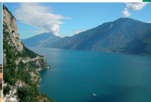
Lago di Garda