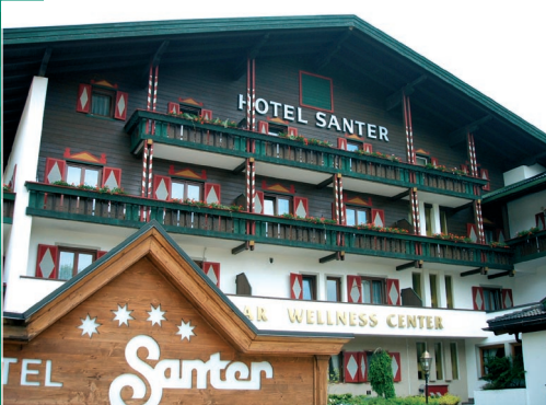
Hotel Santer, Toblach