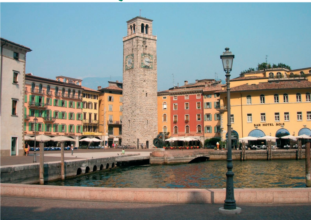
Riva del Garda