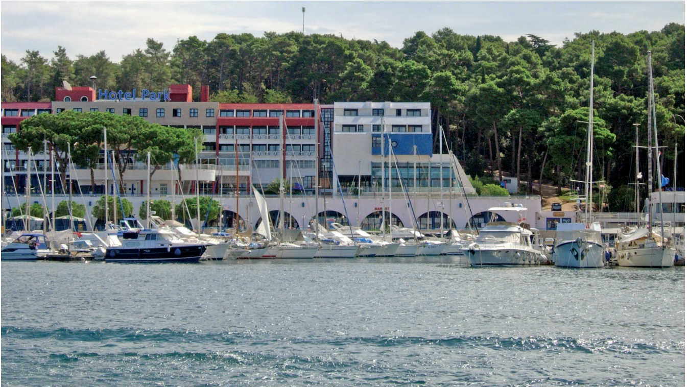
Park Hotel, Rovinj