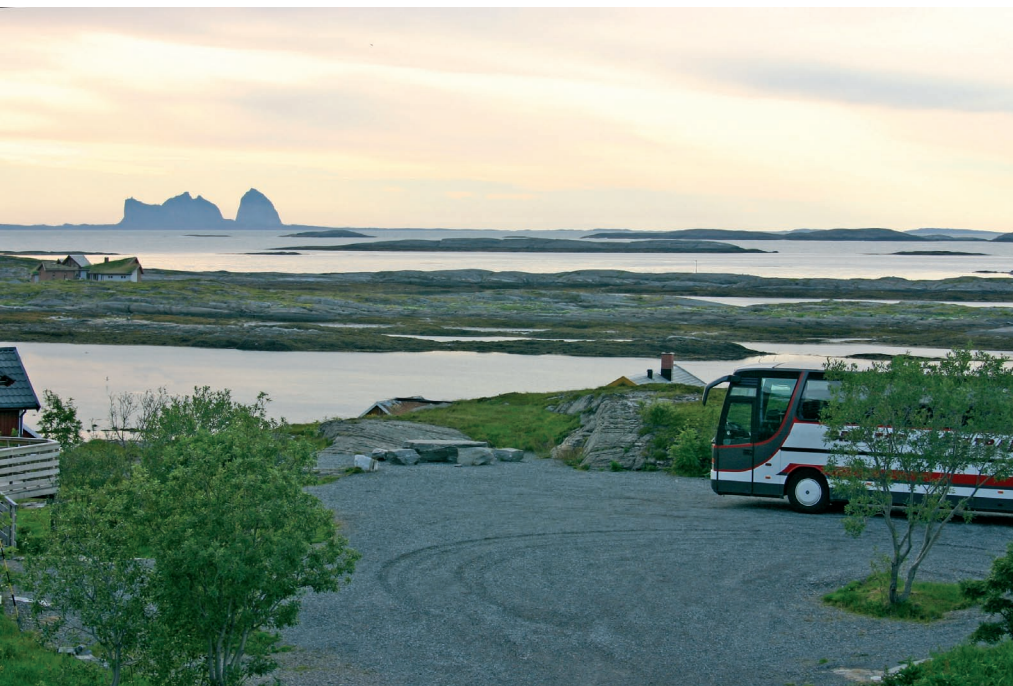
Fra Lovund mot Træna

Flere har reist kystriksvegen langs Helgelandskysten med skiftende kystlandskap med høye fjell og fruktbare sletter ut mot havet. På denne turen tar vi en avstikker ut til den ytterste del av kyststripen, til Lovund og Træna. Levende småkystsamfunn på øyer med høye fjell. På Lovund har en av Norges største lundefuglkolonier sitt tilholdssted.