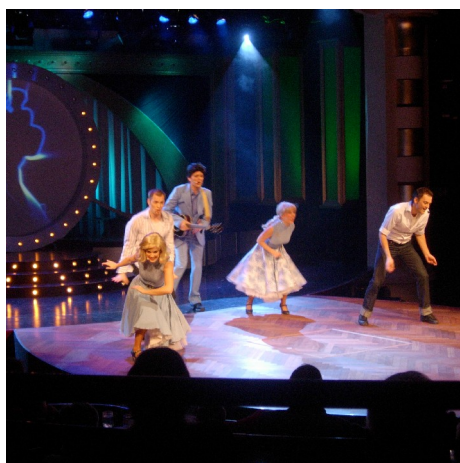
Show, Color Fantasy