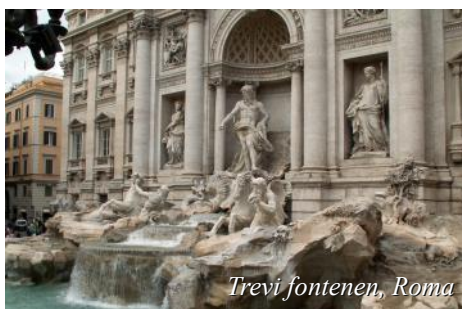
Trevi fontenen, Roma