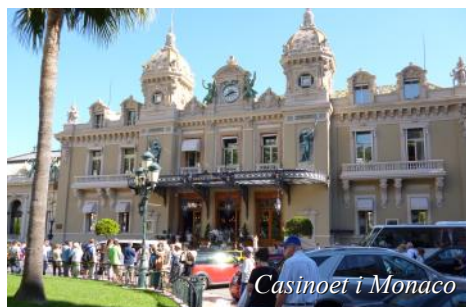
Casinoet i Monaco