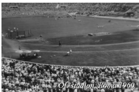
OL-stadion, Roma 1960