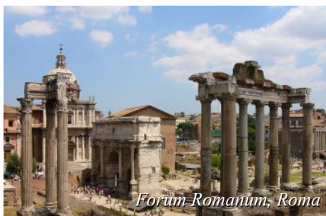
Forum Romanum, Roma