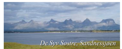
De Syv Søstre, Sandnessjøen

Turen fortsetter i fint kystlandskap til Alstahaug hvor vi besøker Peter Dass Museet. Videre med ferje fra Tjøtta til Forvik og ferje Anndalvågen - Horn. Videre forbi Brønnøysund før vi på ettermiddagen tar ferje Vennesund - Holm. Middag på Snåsaheia og retur til Trondheim på kvelden.