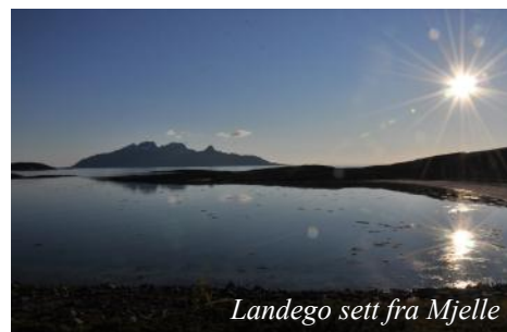
Landego sett fra Mjelle