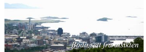
Bodø sett fra utsikten