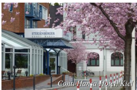
Conti Hansa Hotel, Kiel