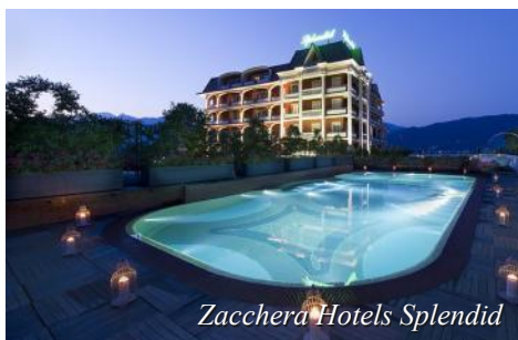
Zacchera Hotels Splendid

Vi fortsetter sørover forbi München og frem til Østerrike ved Kufstein. Videre forbi Tyrols hovedstad Innsbruck, over Brennerpasset og til Italia. Vi kjører frem til Desenzano i sørenden av Gardasjøen. Her blir det overnatting i 3 netter på Hotel Bonotto.