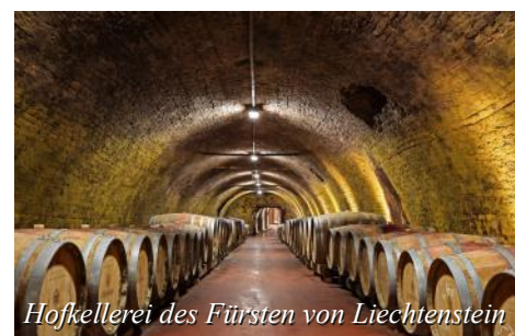
Hofkellerei des Fürsten von Liechtenstein