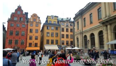
Stor-torget, Gamle stan, Stockholm