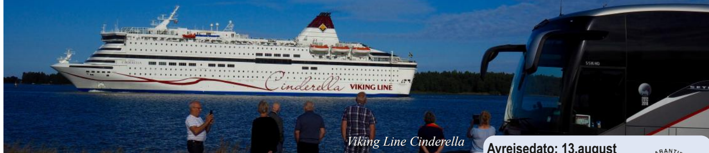
Viking Line Cinderella

På denne turen er vi ombord i Viking Lines store ferje Cinderella i 3 netter.