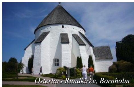
Osterlars Rundkirke, Bornholm

Båten anløper Rønne på Bornholm kl. 11.30 og har avgang kl. 18.00. Man kan besøke Rønne eller delta på en utflykt rundt på Bornholm. Da får man og besøke en av øyas mange rundkirker.