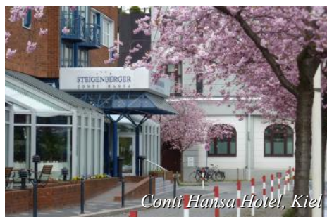
Conti Hansa Hotel, Kiel