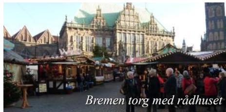
Bremen torg med rådhuset