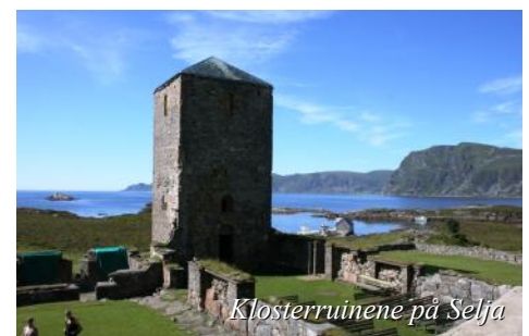
Klosterruinene på Selja

Vi har kommet til turens siste dag, og etter frokost kjører vi Ørnefjellsvegen til Norddal, der tar vi ferjen over til Linge. Turen går videre oppover Valldalen før vi kjører ned Trollstigen. Det blir flere stopp på turen til Trøndelag, og vi skal ha en god middag på Dombås.