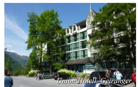
Union Hotell, Geiranger