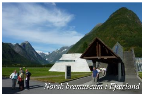
Norsk bremuseum i Fjærland