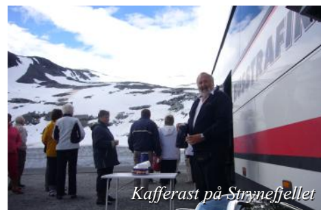
Kafferast på Strynefjellet