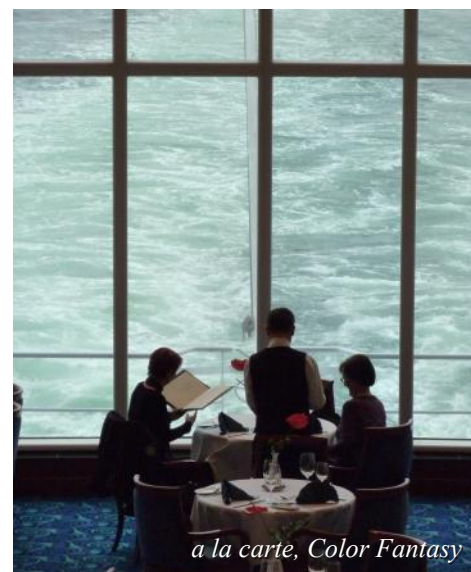
a la carte, Color Fantasy