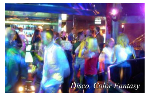
Disco, Color Fantasy