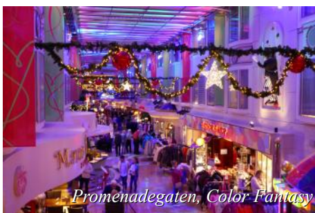
Promenadegaten, Color Fantasy