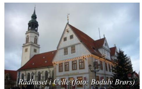
Rådhuset i Celle