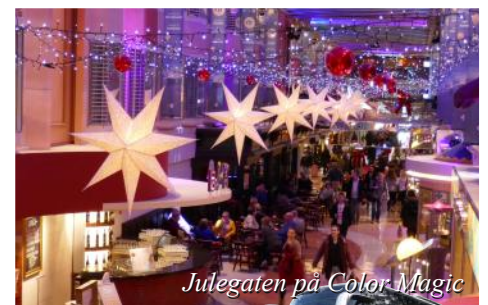
Julegaten på Color Magic