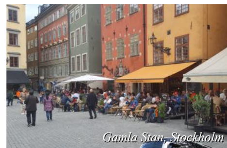
Gamla Stan, Stockholm