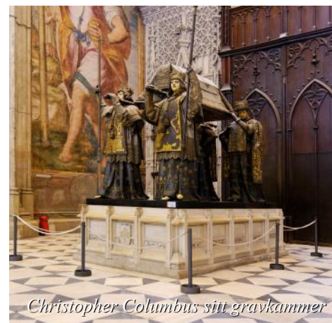
Christopher Columbus sitt gravkammer