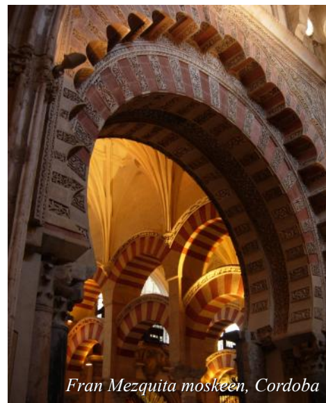
Fra Mezquita moskeen, Cordoba