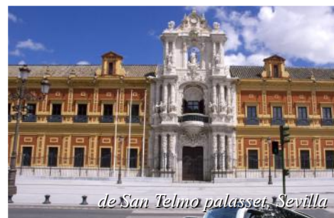
de San Telmo palasset, Sevilla