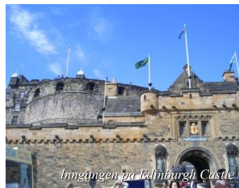
Inngangen på Edinburgh Castle

NB! Flasker kjøpt utenfor flyplassen før hjemreise pakkes ned i koffert i sendt bagasje. De er ikke tillatt medbragt gjennom sikkerhetskontrollen.