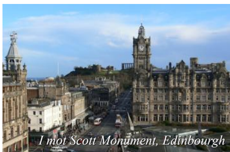
I mot Scott Monument, Edinburgh