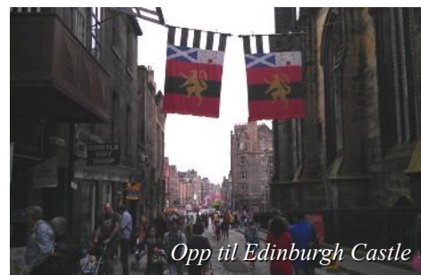
Opp til Edinburgh Castle

Etter frokost kjører vi ut til flyplassen. Kl. 11.25 avreise med SAS til Stockholm kl. 14.35. Videre med SAS fra Stockholm kl. 17.05 til Værnes kl. 18.15.