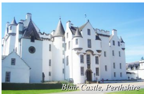
Blair Castle, Perthshire