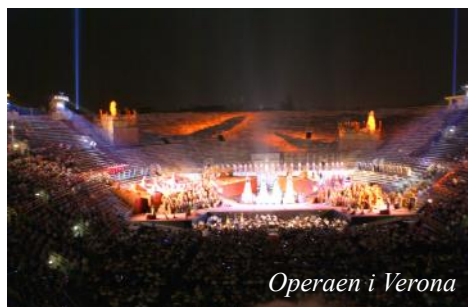
Operaen i Verona