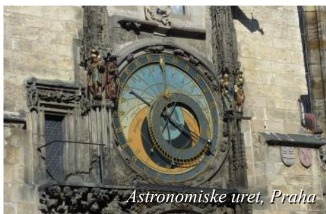
Astronomiske uret, Praha