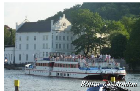
Båttur på Moldau