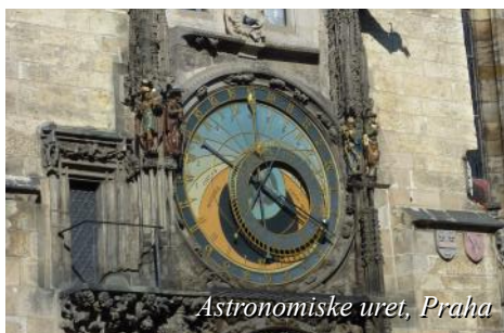
Astronomiske uret, Praha