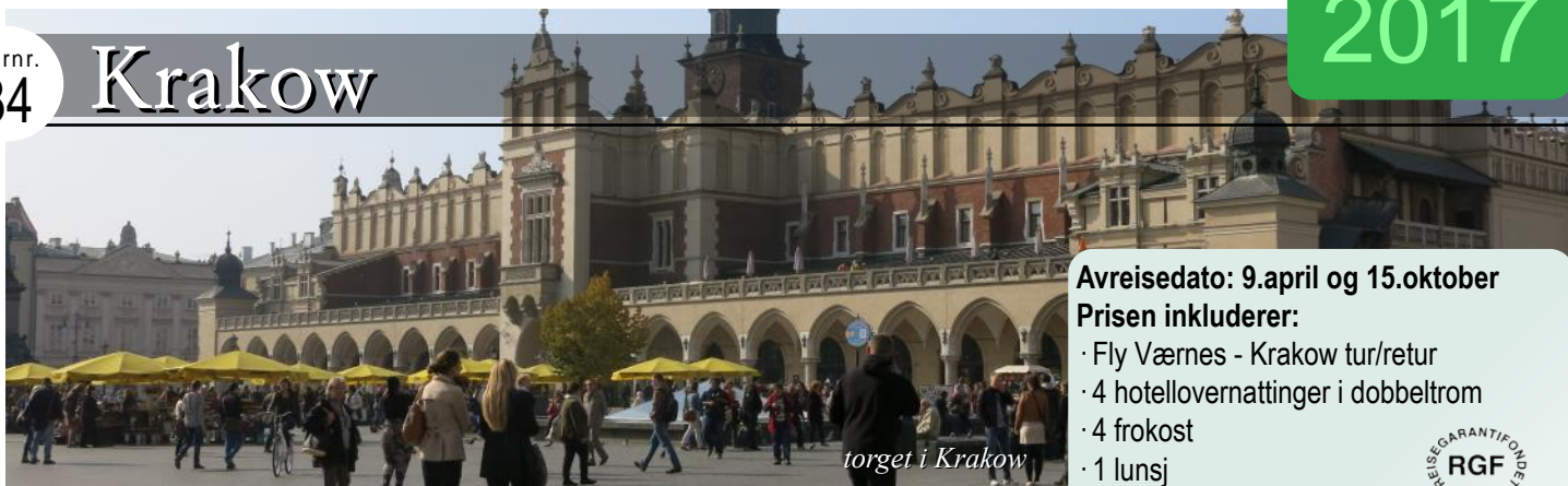
torget i Krakow

Denne reisen foregår med Norwegians direktefly mellom Værnes og Krakow tur/retur. Krakow var Polens hovedstad frem til 1596 og er kjent for sin vakre arkitektur. Byens torg er relativt uforandret siden 1300-tallet og er et av Europas største torg fra middelalderen. Midt på torget ligger en stor torghall med mange ulike butikker hvor man kan kjøpe mye fint polsk håndarbeid. Over byen ruver det store gamle kongeslottet Wavel. Gamlebyen har også et gammelt jødisk kvarter, Kazimierz. Vi bor sentralt med gangavstand til gamlebyen, Stare Miasto.