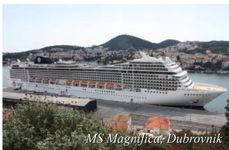
MS Magnifica, Dubrovnik