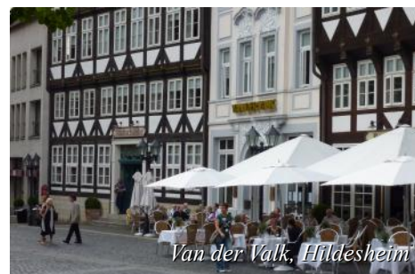
Van der Valk, Hildesheim