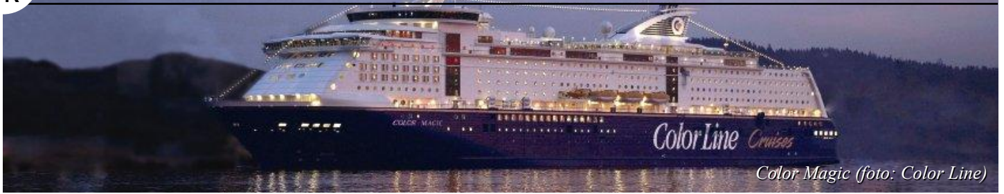
Color Magic