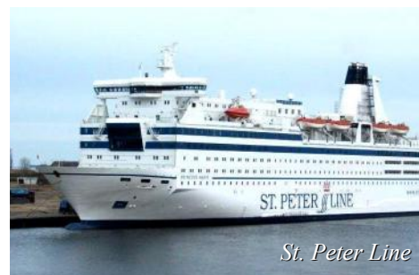
St. Peter Line

Ankomst Stockholm kl. 07.00. Turen går nordover forbi Uppsala, Gävle og frem til Sundsvall. Videre forbi Østersund og over Storlien. Retur til Trondheim og Steinkjer hvor turen avsluttes sent på kvelden.