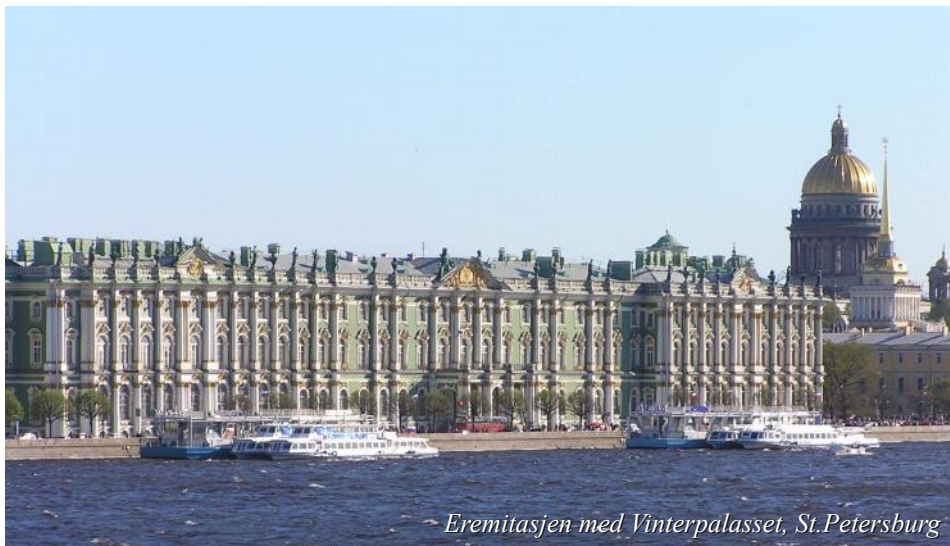
Eremitasjen med Vinterpalasset, St.Petersburg

Peter den store drømte allerede på 1700-tallet at det en dag skulle være mulig å seile mellom St.Petersburg og Moskva, men drømmen ble først virkelighet etter hans død. I dag seiler vi mellom de to metropolene, gjennom Russlands hjerte, takket være en omfattende bygging av kanaler og sluser. Med vårt flytende hotell som utgangspunkt får du oppleve byene og seilassen mellom dem, Europas to største innsjøer, Ladoga og Onega, gjennom 18 sluseanlegg og de mektige elvene Neva, Svir og Volga.