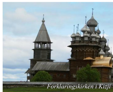
Forklaringskirken i Kizji