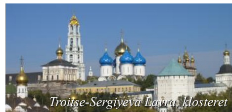
Troitse-Sergiyeva Lavra, klosteret