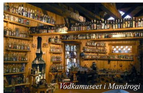
Vodkamuseet i Mandrogi