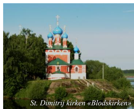
St. Dimitrij kirken «Blodskirken»