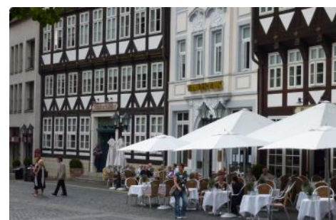
Van der Valk, Hildesheim