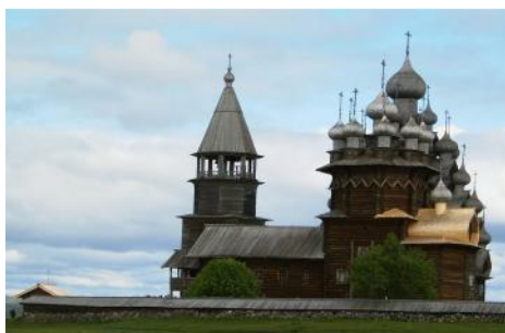
Forklaringskirken i Kizji

Idag er det utflukt til Kreml, maktens sentrum i verdens største land. En vandring i dette området, med sine store katedraler og palasser, er obligatorisk for alle Moskva-besøkende. Etter lunsj kan man utforske Moskva på egen hånd eller bli med på en av utfluktene som skipet tilbyr. Man kan besøke Rustningsmuseet, tsarens rikholdige skattkammer.