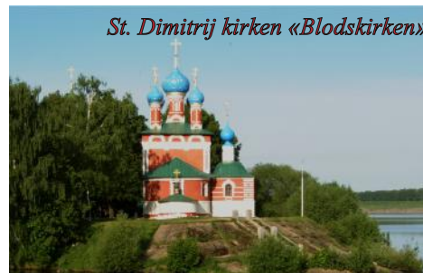
St. Dimitrij kirken «Blodskirken»