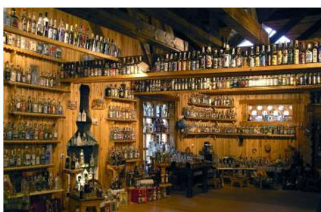
Vodkamuseet i Mandrogi

Etter lunsj legger vi til kai i Jaroslavl, en viktig havneby med 600 000 innbyggere. Her skal vi på en byrundtur for å beundre byens mange flotte bygninger, blant annet flere majestetiske katedraler fra 1600-tallet, Spasko-klosteret og Elias-kirken.