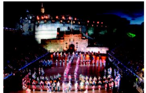
Military Tatroo, Edinburgh

Denne turen starter i Skottlands hovedstad Edinburgh. Vi får oppleve skotsk kultur med skotsk aften og Military Tattoo ved Edinburgh Castle. Vi fortsetter med buss sørover forbi Newcastle og til Yorkshire. Yorkshire er områdene på østkysten av England sør for Newcastle. Terrenget er kupert og har store nasjonalparker med lyngheier. Midt i disse lynghelene ligger landsbyen Goathland, bedre kjent som «Aidensfield» gjennom den populære tv-serien på lørdagskveldene. Vi tar også en tur med det gamle damptoget som går gjennom naturparken. Vi besøker også York med sin gamle vikingeby «Jorvik» og katedralen York Minster. Vi benytter SAS via Stavanger til Aberdeen på utreisen og Norwegian direktefly fra London til Værnes på returnen.