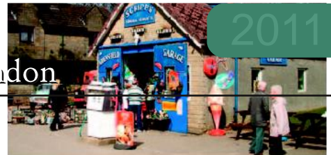
Mr. Scripps Garage, Aidensfield