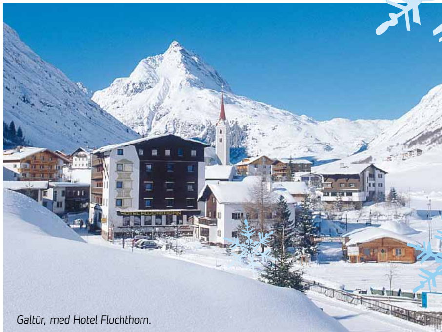
Galtür, med Hotel Fluchthorn.