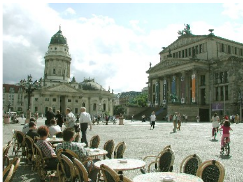
Cafe Gendarmenmarkt, Berlin