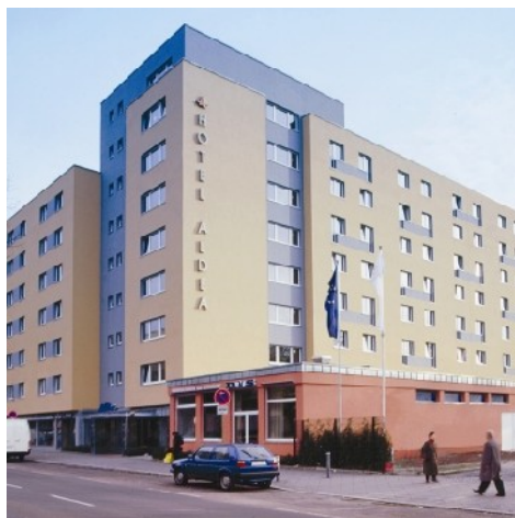
Hotel Aldea, Berlin

Ankomst Oslo kl.09.30. Turen går nordover Gudbrandsdalen og opphold på Dombås. Retur til Trøndelag på kvelden.